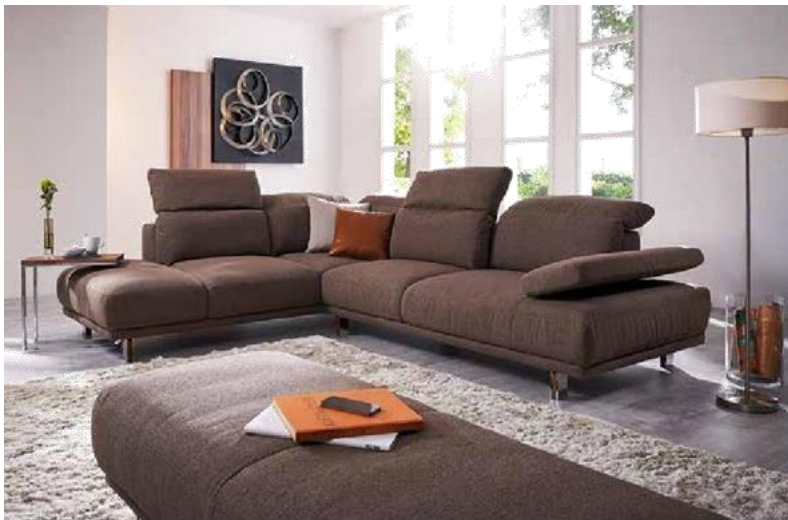
Potah: W72/52 chocolate