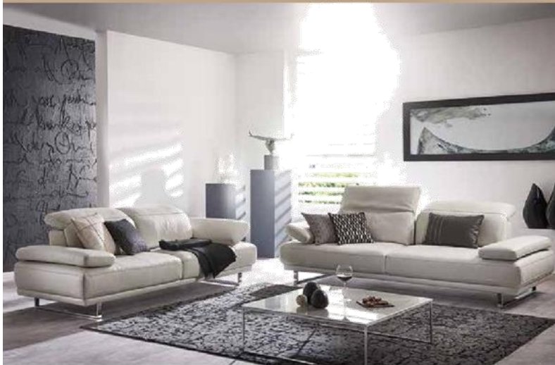
Potah: Z73/43 creamwhite